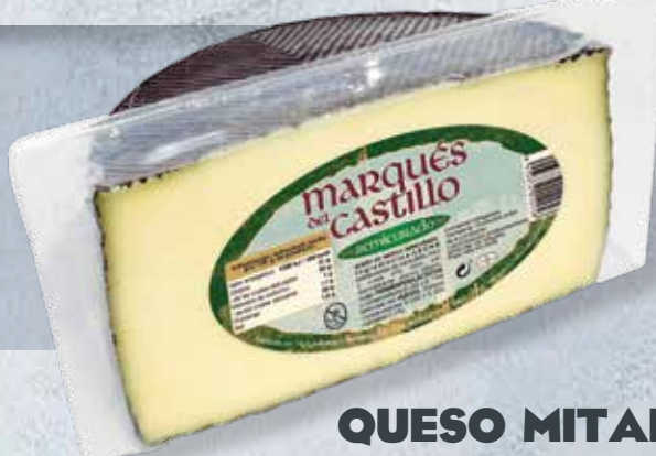
QUESO MITADES SEMI 10,01 €/KG CURADO MEZCLA 10,41 €/KG