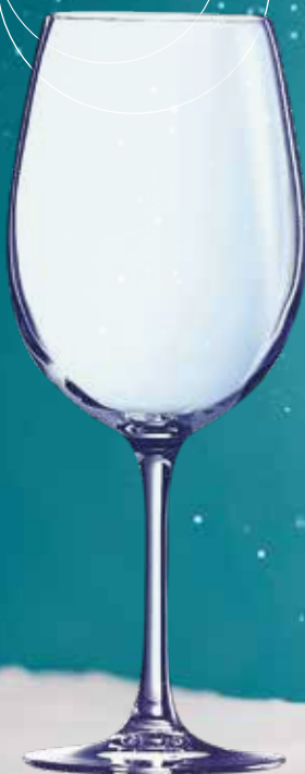
VINTAGE 75 CL