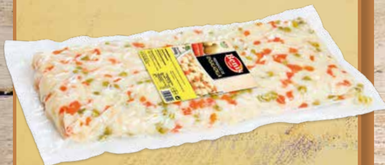
PREPARADO PARA ENSALADILLA COCIDO Y TROCEADO BOLSA DE 2 Kg