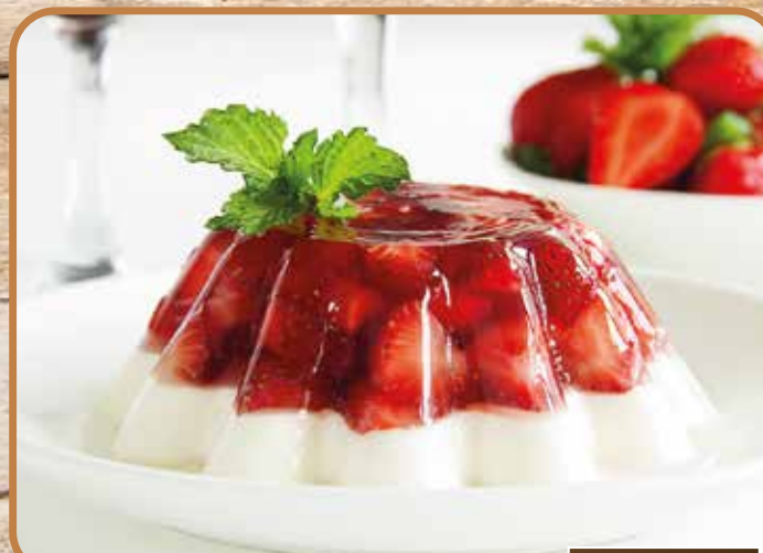
GELATINA BRILLO APLICABLE EN FRÍO