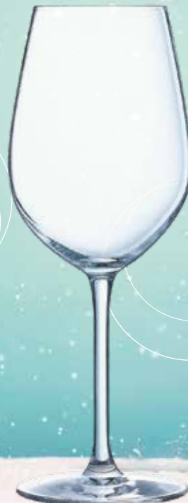
EVOQUE 55 CL