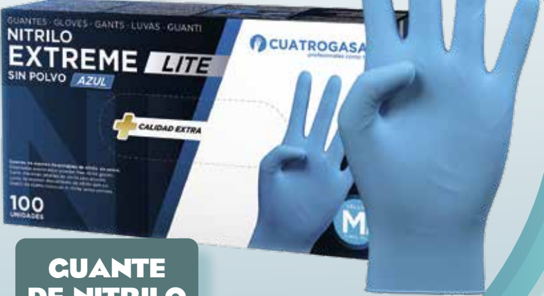
GUANTE DE NITRILO AZUL