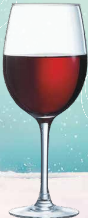
MINERAL 45 CL