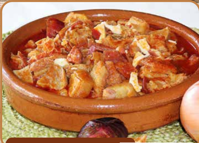
CALLOS A LA LEONESA