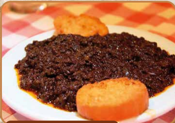
MORCILLA EN CUBO 3 KC