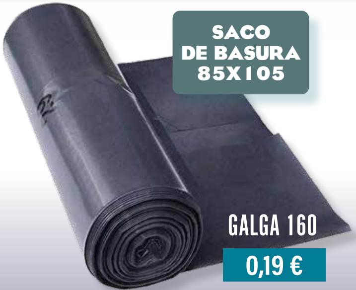
SACO DE BASURA 85X105