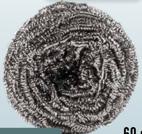
NANA DE ACERO