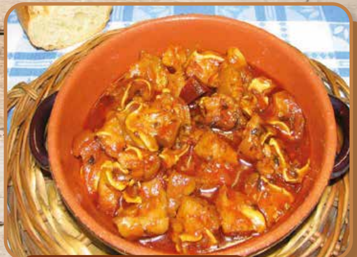
OREJA EN SALSA