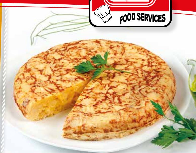
TORTILLA FRESCA CON CEBOLLA - 1 KG