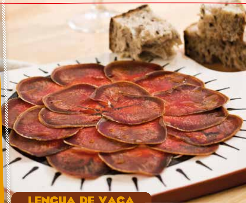
LENGUA DE VACA COCIDA - CURADA PIEZAS 750/950 gr