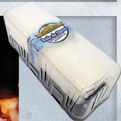
RULO CABRA MEZCLA PIEZA 850 gr 9,21 €