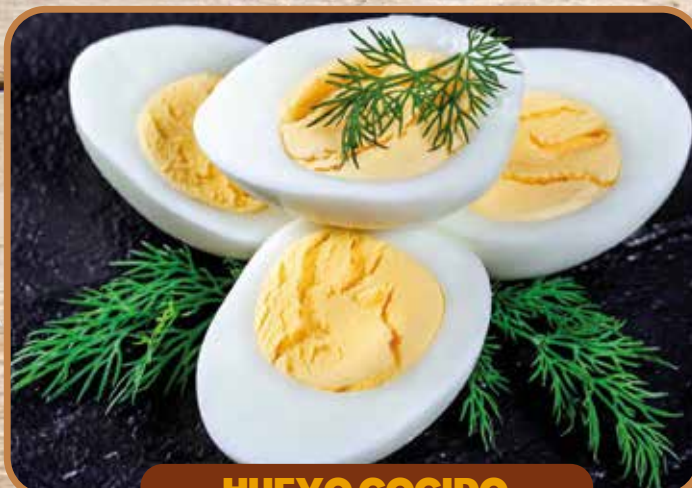
HUEVO COCIDO PELADO CUBO 70