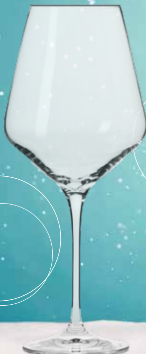
GARDEN 60 CL