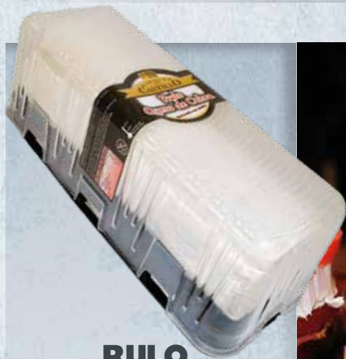
RULO CABRA 100% PIEZA 1 KG 12,40 €