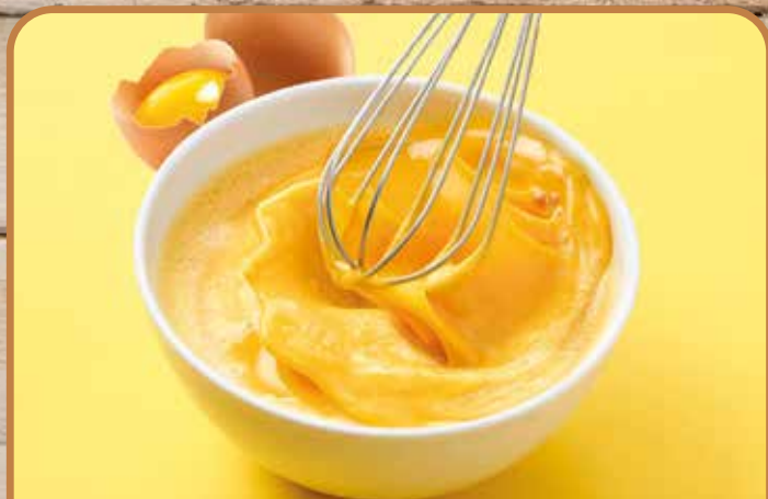
HUEVO LÍQUIDO PASTEURIZADO ■ BRIK 1 L