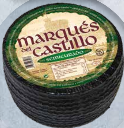
SEMI CURADO PIEZA 3 KG 9,75 €/KG