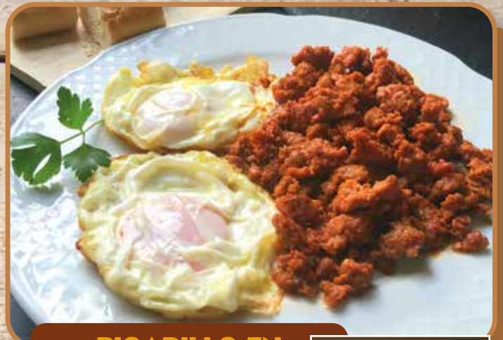
PICADILLO EN CUBO 3 KC