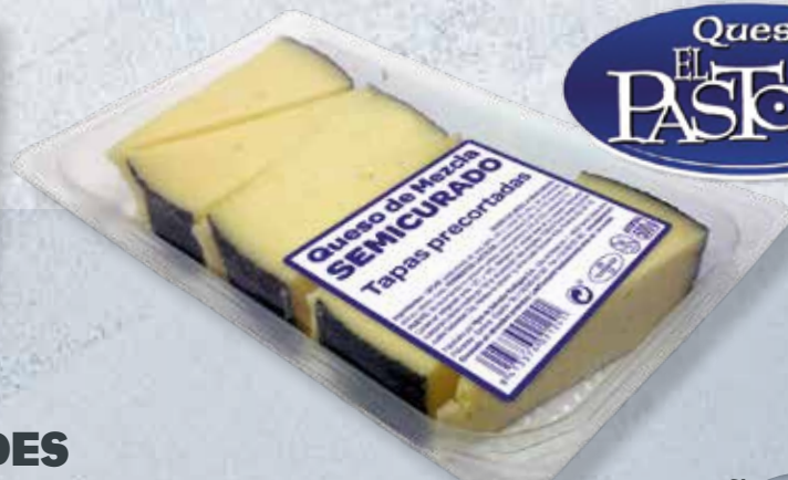
QUESO SEMI CUÑAS PIEZA 14 gr 0,20 €/Cuña