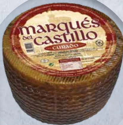
CURADO MEZCLA PIEZA 3 KG 10,14 €/KG