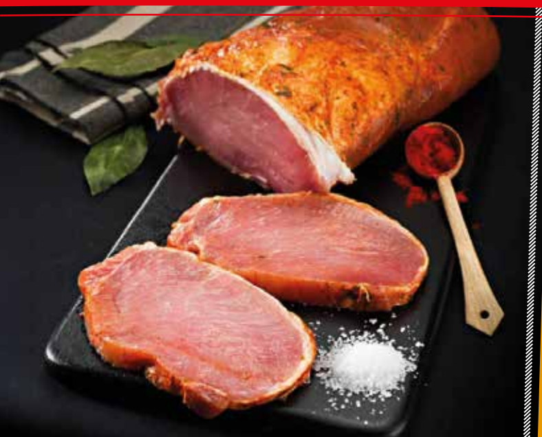
LOMO ADOBADO FRESCO NATURAL