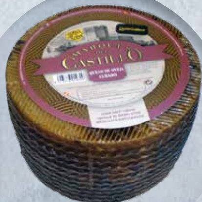
OVEJA 100% LECHE CRUDA PIEZA 3 KG 15,45 €/KG