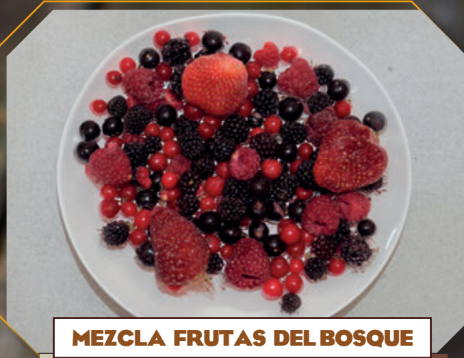
MEZCLA FRUTAS DEL BOSQUE