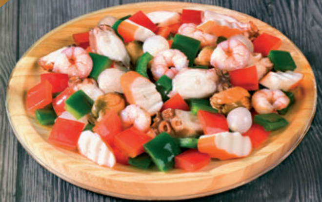
SALPICÓN DE MARISCO