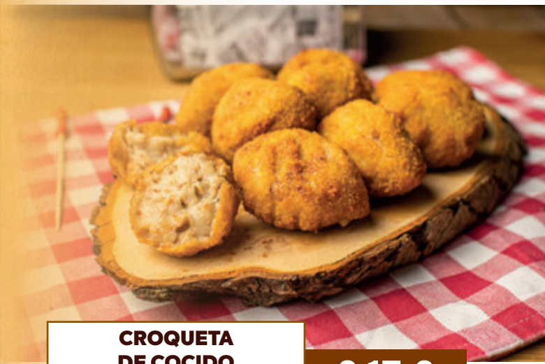
CROQUETA DE COCIDO