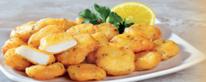
TAQUITOS DE SEPIA REBOZADA