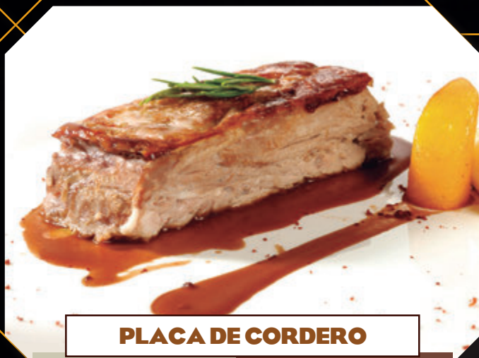
PLACA DE CORDERO