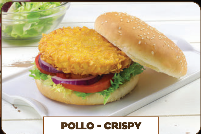
POLLO - CRISPY 125 gr 1,56 €