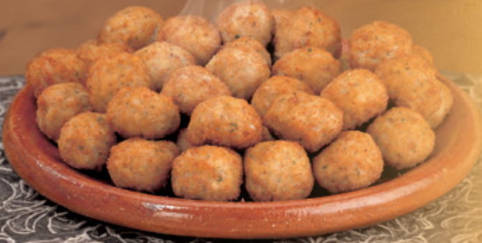
ALBÓNDIGA DE CERDO