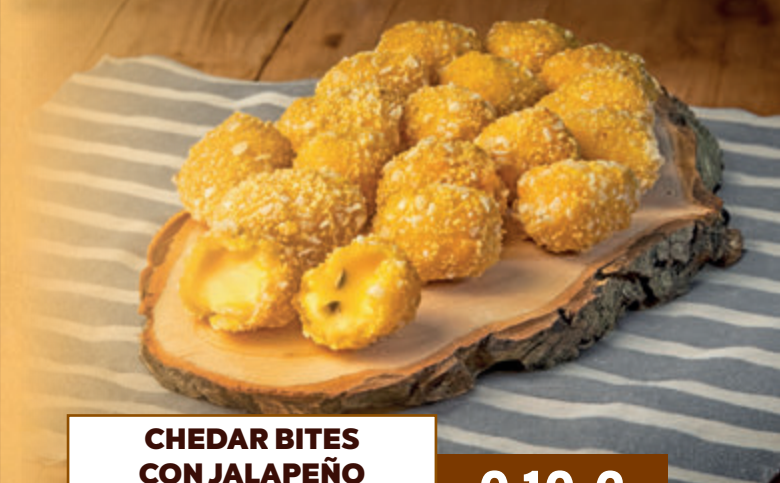
CHEDAR BITES CON JALAPEÑO