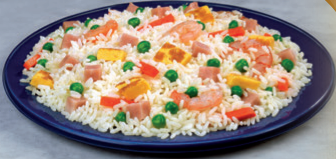
ARROZ TRES DELICIAS