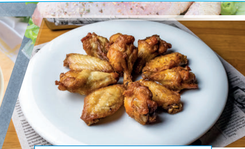
ALAS GRILL PREFRITA