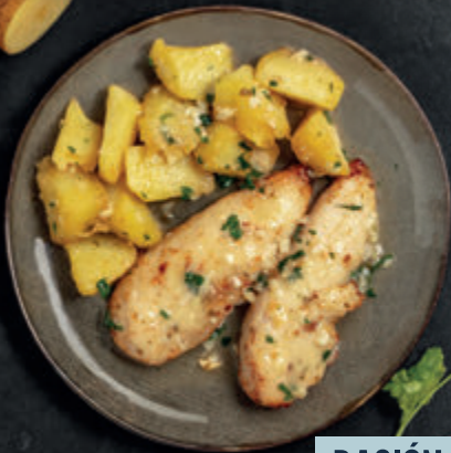
POLLO A LA CAZUELA

3 MINUTOS EN EL MICROONDAS DESDE CONGELADO Y LISTO