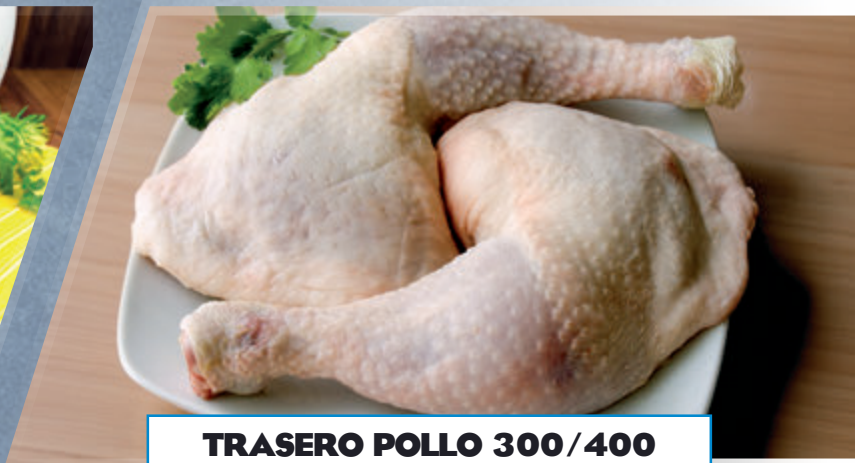
TRASERO POLLO 300/400