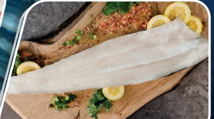
FILETE MERLUZA AUSTRAL