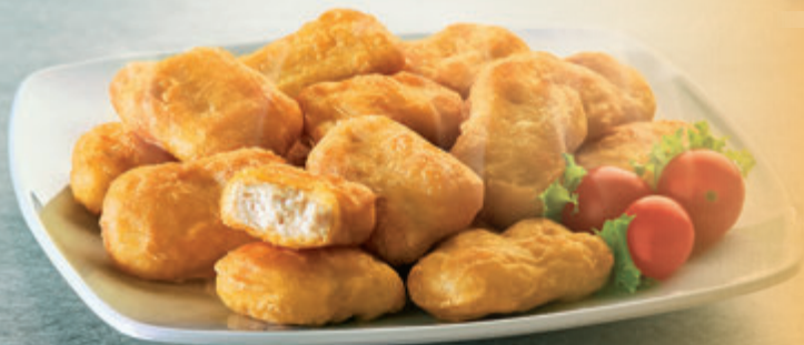
NUGGETS DE POLLO