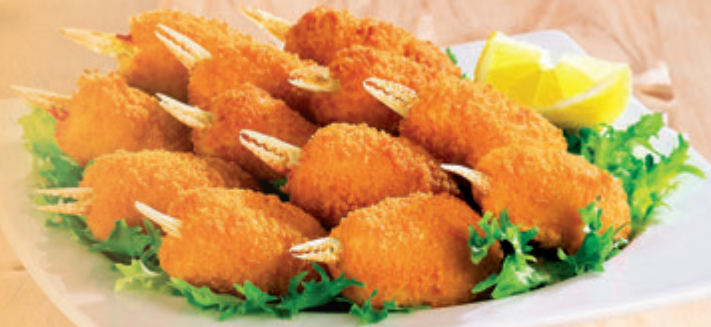
MUSLITOS DE MAR