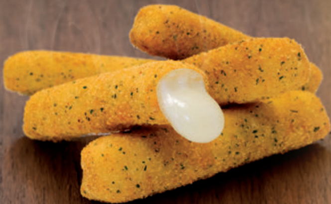
FINGER DE MOZZARELLA