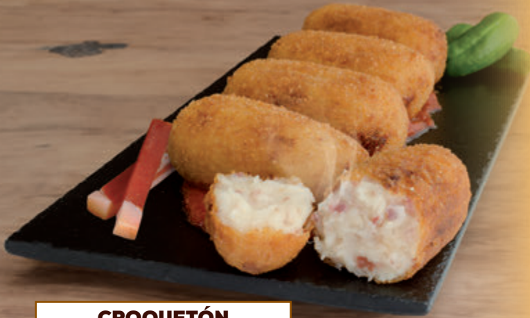
CROQUETÓN DE JAMÓN