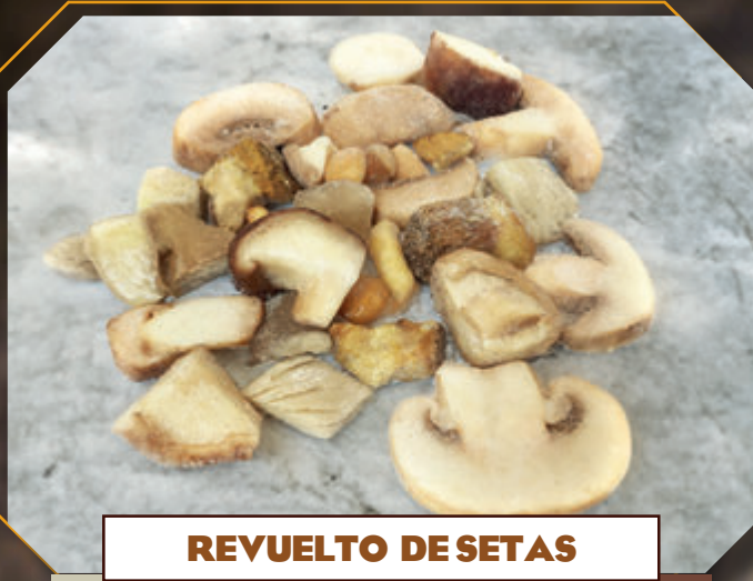
REVUELTO DE SETAS