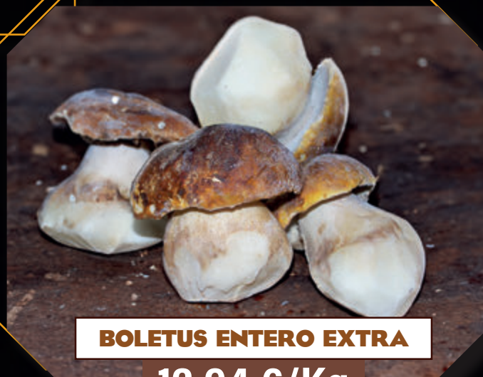
BOLETUS ENTERO EXTRA