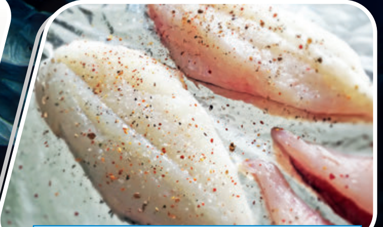
FILETE GALLO SAN PEDRO