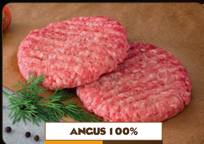
ANCUS 100% 160 gr 2,29 €