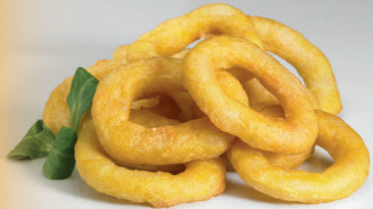
ARITO REBOZADO SURIMI