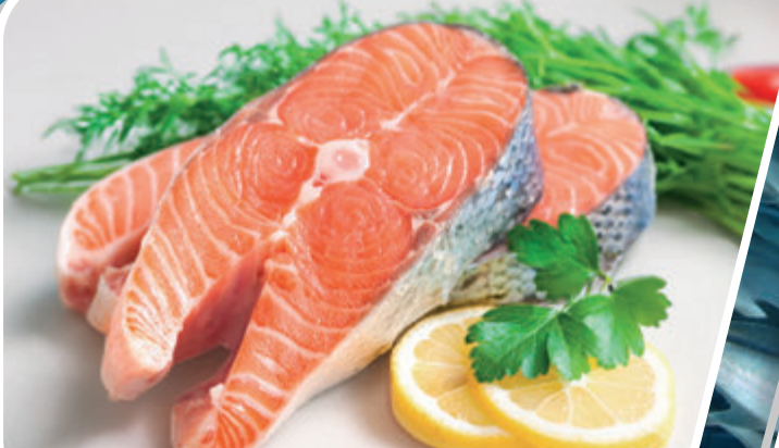
RODAJA DE SALMÓN