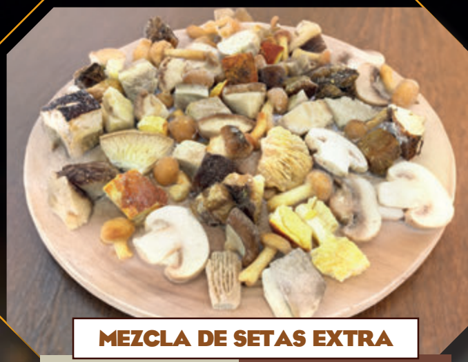
MEZCLA DE SETAS EXTRA