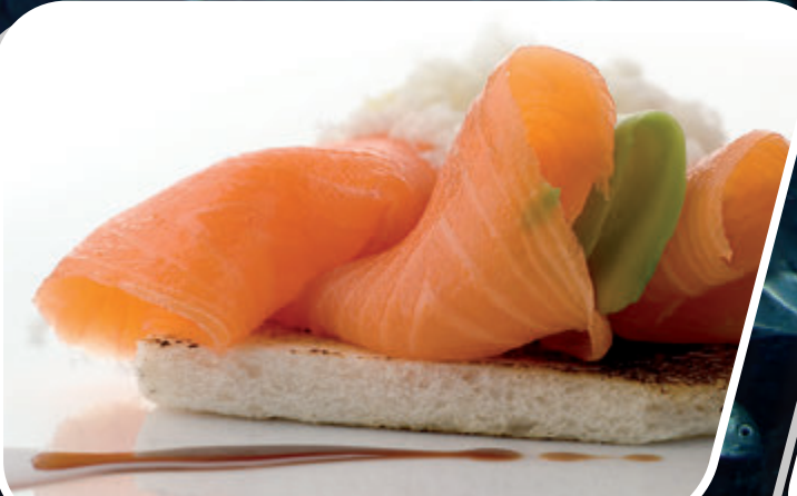
SALMÓN AHUMADO PLANCHA