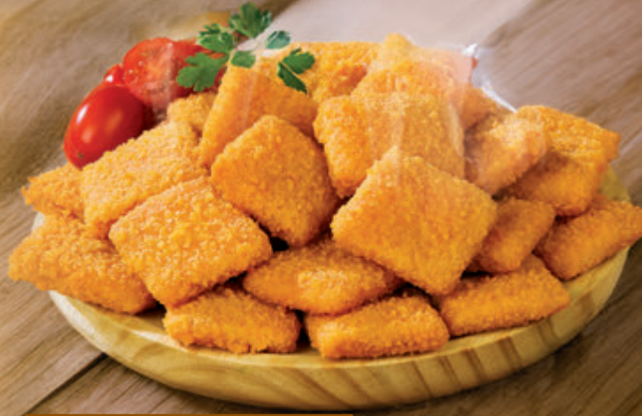
MINI SAN JACOBO