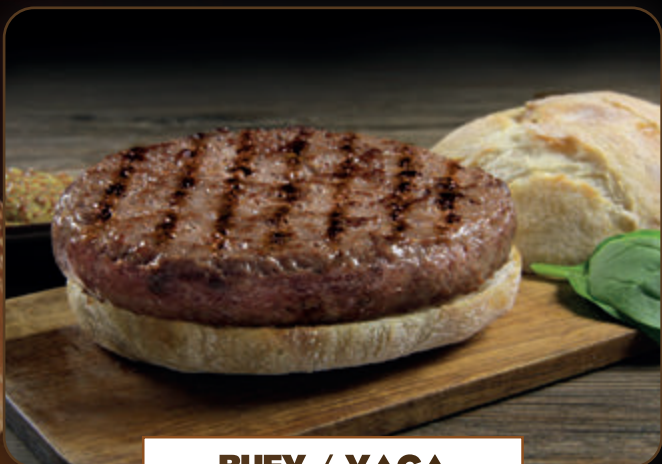
BUEY / VACA 200 gr 1,99 €