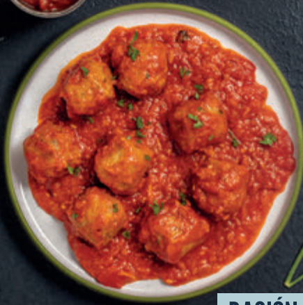
ALBÓNDIGA CON TOMATE