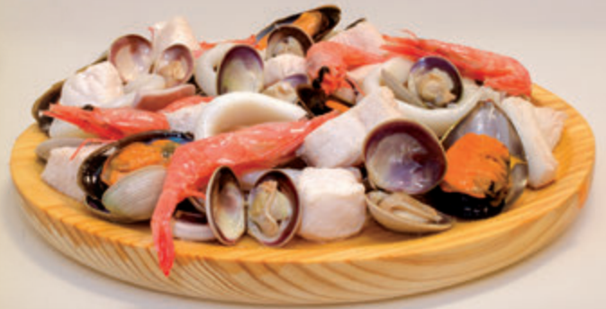
PREPARADO PARA PAELLA