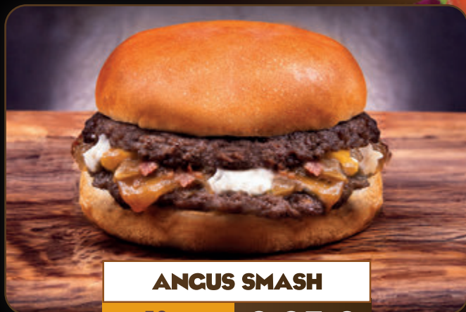
ANCUS SMASH 50 gr 0,65 €