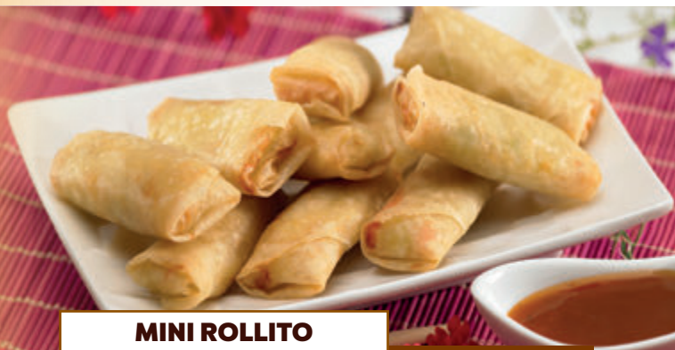
MINI ROLLITO DE PRIMAVERA