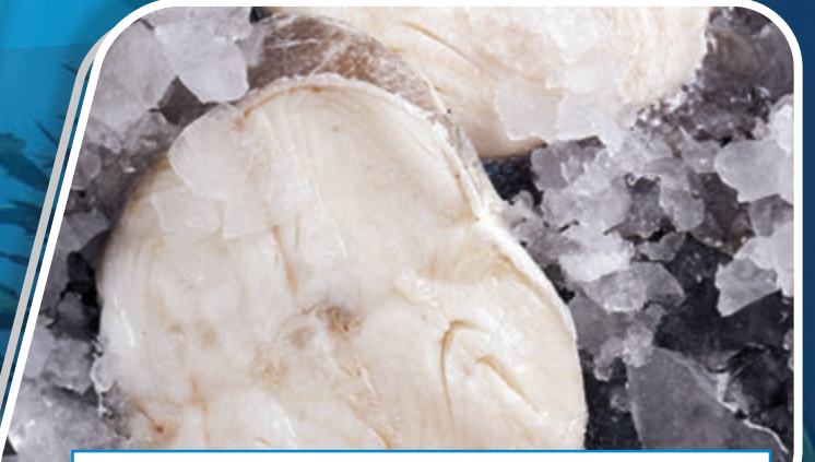
RODAJA MERLUZA AUSTRAL