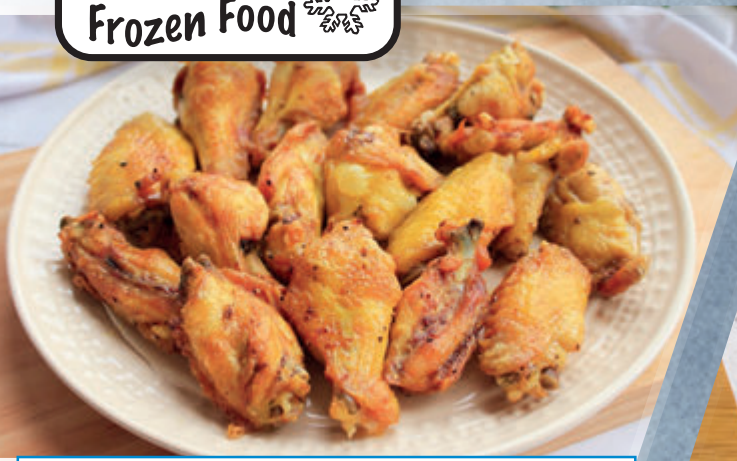
ALAS PARTIDAS UVESA