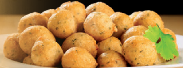
BUÑUELOS DE BACALAO