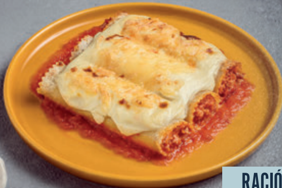
CANELONES DE CARNE