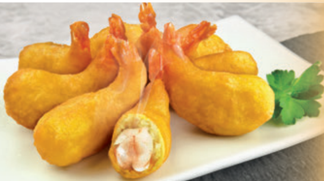
LANGOSTINO REBOZADO (Cola vista)