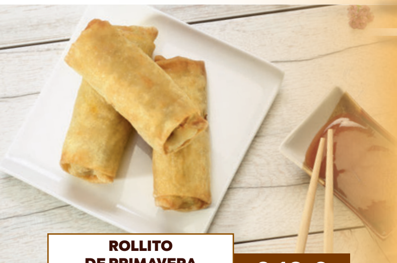
ROLLITO DE PRIMAVERA