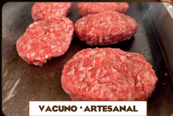
VACUNO - ARTESANAL 180 gr 1,87 €