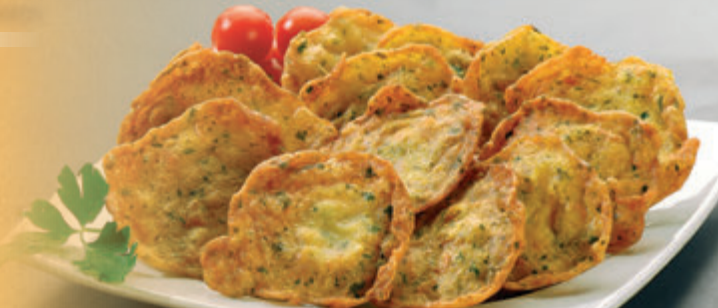
TORTILLITA DE CAMARONES