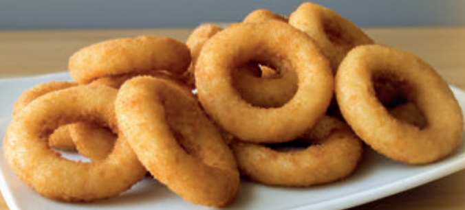
AROS DE CEBOLLA