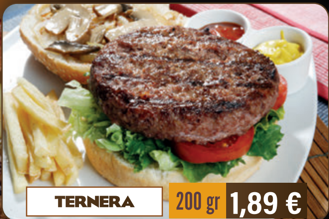
TERNERA 200 gr 1,89 € 110 gr 0,99 € 80 gr 0,59 €