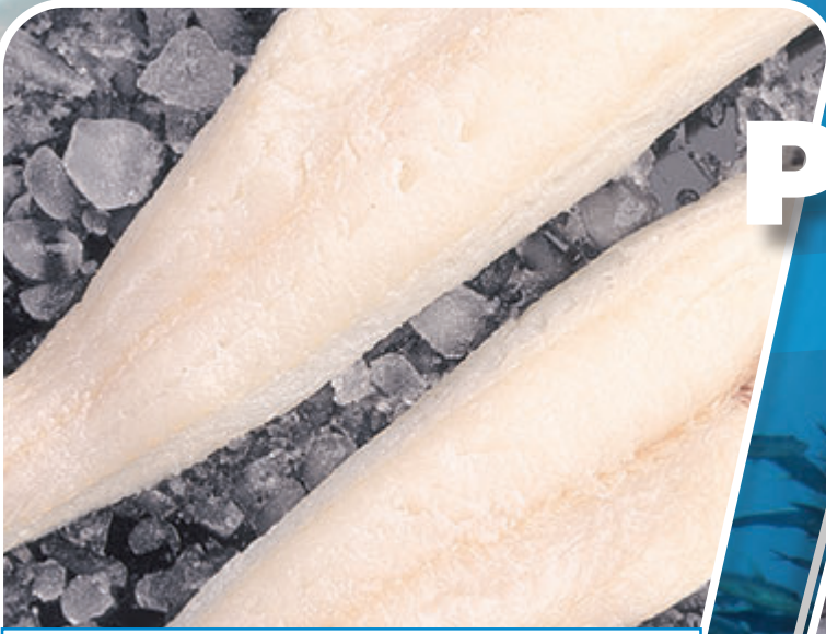
FILETE DE BACALAO • ISLANDIA