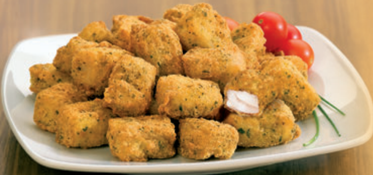
BACALAO EN TACOS REBOZADO