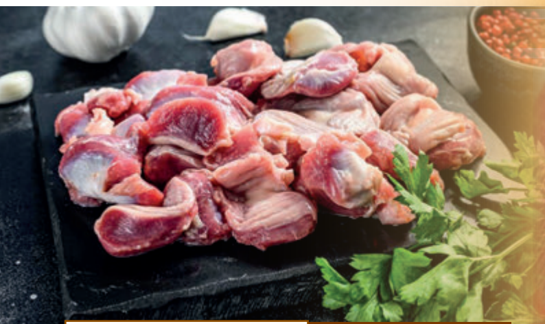
MOLLEJA DE POLLO (Limpia)